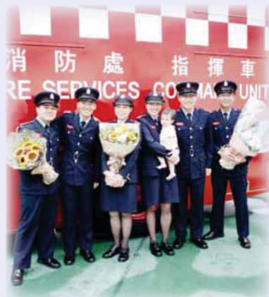
● 「C54」六位結業學員 The six graduates of C54