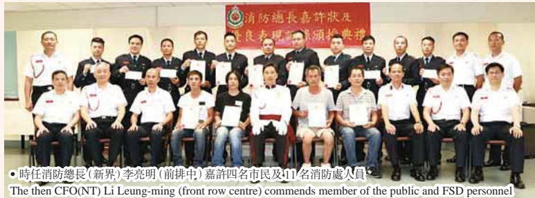
時任消防總長(新界)李亮明(前排中)嘉許四名市民及11名消防處人員。The then CFO(NT) Li Leung-ming (front row centre) commends member of the public and FSD personnel.