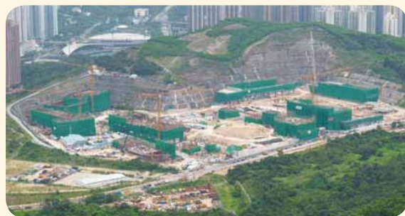
● 興建中的新消防訓練學校工程進度理想 Construction works of the new Fire Services Training School are in good progress

「消防博物館暨教育中心」則設有三個展覽廳，分別展示不同時期的制服、工具及車輛，以介紹消防處的歷史及發展。教育中心亦提供互動及多媒體資訊設施和不同的體驗區，例如火場逃生體驗區、滅火體驗區及急救體驗區，以推廣消防安全知識及教育公眾急救技巧。