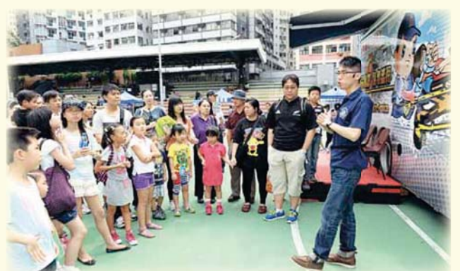
由救護主任擔任的導賞員在灣仔修頓球場舉行的慎用救護服務巡迴展覽中向參觀者講解 An Ambulance Officer guides visitors at the Ambulance Service Roving Exhibition at Southern Playground in Wan Chai