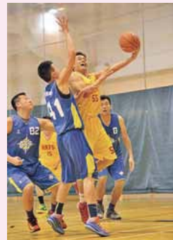
紀律部隊杯3打3籃球賽 Disciplined Services 3 on 3 Basketball Tournament