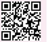
手機看相 Shoot and view the photos